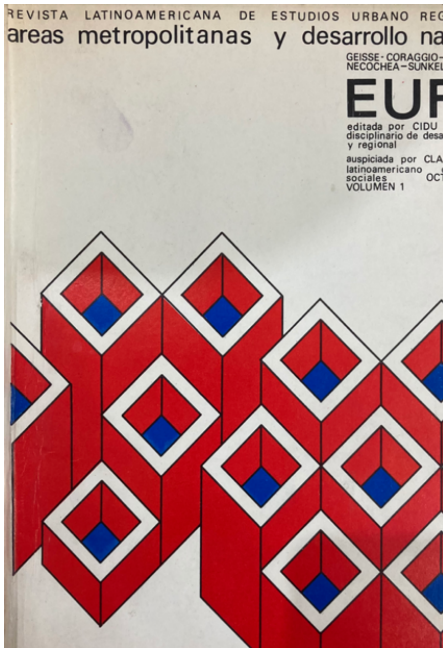
Imagen 2. Primera edición de la Revista Latinoamericana de Estudios Urbano Regionales